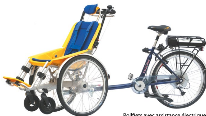
Rollfiets avec assistance électrique